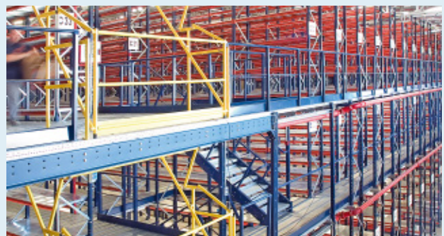
Poprzednie archiwum, wyposażone w tradycyjne rozwiązanie